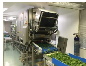
異物除去カラーソーター（色彩選別機）