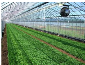
高瀬式14回転ハウス (低コスト高収量ハウス)

当社は2008年の農業参入当初からベビーリーフ年間生産1,000トン構想を掲げてまいりました。その早期実現に向けて、農場及び工場の機械化・IT化に向けた設備投資並びに研究開発投資を重要施策と位置づけ、今後も熊本県内外における生産拡大を加速します。このため、資金需要が一段と高まることから、九州域内において地域活性化に繋がる各種事業に積極的に取り組んでいる北九州銀行との提携により、安定した事業拡大と収益力強化に取り組んでまいります。