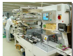
大型横ピロー包装機