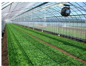
高瀬式14回転ハウス (日本初高回転ハウス)

当社は2008年の農業参入当初からベビーリーフ年間生産1,000トン構想を掲げてまいりました。その早期実現に向けて、農場及び工場の機械化・IT化に向けた設備投資並びに研究開発投資を重要施策と位置づけ、今後も熊本県内外での生産拡大を加速します。このため、資金需要が一段と高まることから、一次産業向け融資に国内屈指の実績がある鹿児島銀行との提携により、安定した事業拡大と収益力強化に取り組んでまいります。