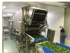
異物除去カラーソーター（色彩選別機）