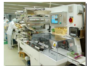
大型横ピロー包装機