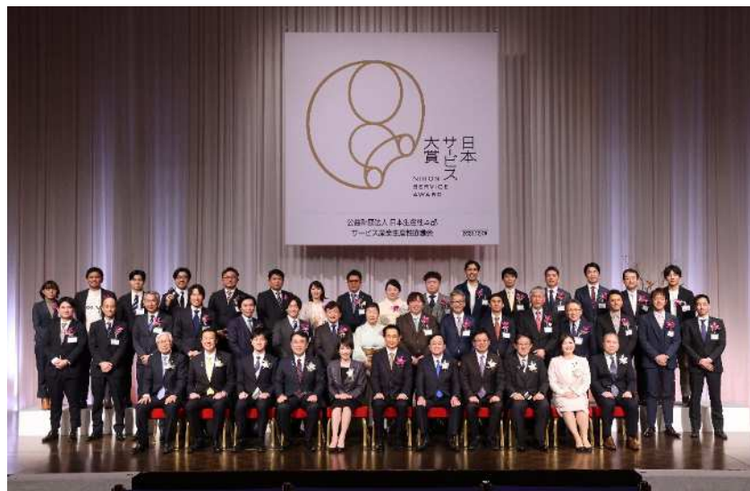
第5回 日本サービス大賞 授賞式

本サービスは、当社グループの高度な栽培技術と豊富な現場改善ノウハウを農業法人に無償で提供し、増産分の流通を通じて長期的に利益を共有するという独自のビジネスモデルを持ちます。こうした革新性と社会性が評価され、2025年12月に開催された「第5回 日本サービス大賞」において(株)果実堂テクノロジーが優秀賞を受賞しました（応募総数768件のうち受賞33件）。また、同事業を含む当社グループの取り組みは「日本のサービスイノベーション 2025」にも選定されており、アグリテック企業としての存在感を一層高めることとなりました。